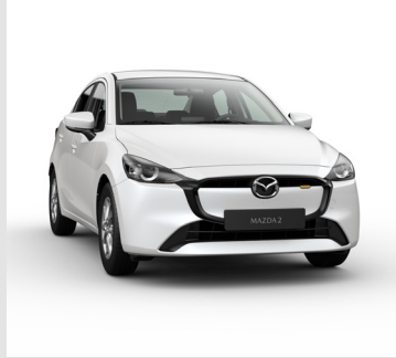
BLANCO NIEVE PERLADO

Las versiones Touring son una propuesta renovada que incluye una combinación especial de colores, tanto en el exterior con el color de grilla del radiador, como en el interior con el color de algunas cubiertas. Verifique atentamente esta combinación en el color exterior seleccionado.