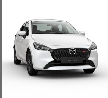
BLANCO NIEVE PERLADO

La versión Grand Touring cuenta con una renovada parrilla delantera color negro que contrasta con un acento en color rojo, otorgándole distinción, mismo acento que se encuentra en el búmer trasero. Al interior se encuentran cubiertas negras con toques en rojo, así como asientos en tela con costuras de este mismo color.